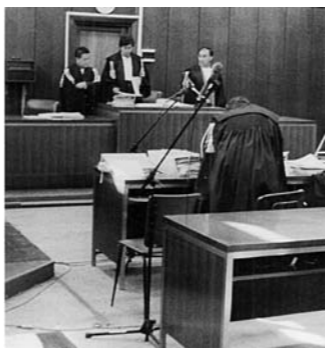
Sentenza contro Banca 121

Da ricordare, comunque, che sono in corso trattative per rilevare la società. Sembra a un passo dalla conclusione l'operazione con la Titan Europe, quotata a Londra da poco più di un anno. Gli inglesi, in pratica, vorrebbero finanziare con un aumento di capitale il